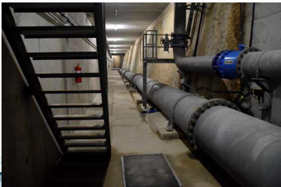
Dipòsit de Can Llong a l'esquerra i dipòsit de Cassà a la dreta

Este concurso fue ganado por la empresa de construcción COMSA, y ésta ha confiado en NEOPROOF para realizar la parte de las impermeabilizaciones del depósito.