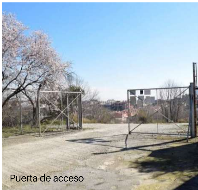
Puerta de acceso

c/ Energia nº 9 t. +34 93 383 91 94 P.I. Les Guixeres f. +34 93 399 03 49 08915 Badalona ineoproof@neoproof-net