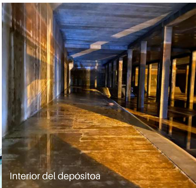
Interior del depósito