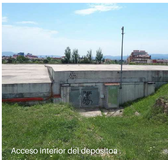
Acceso interior del depósito