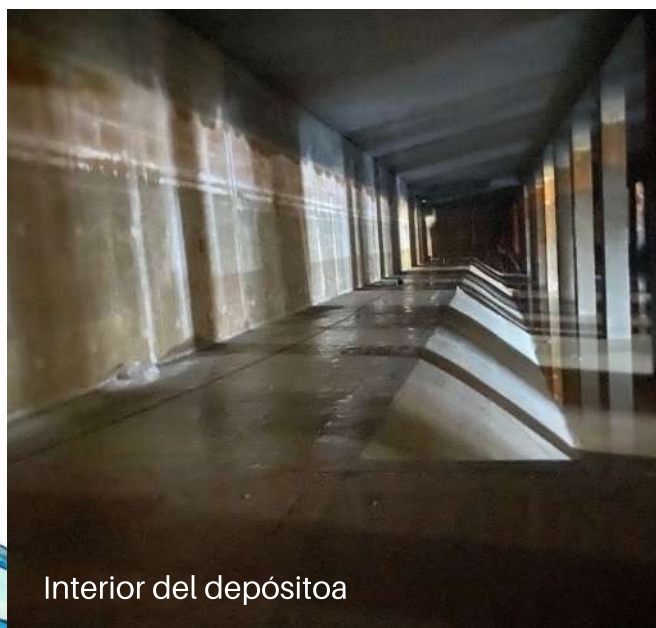
Interior del depósito